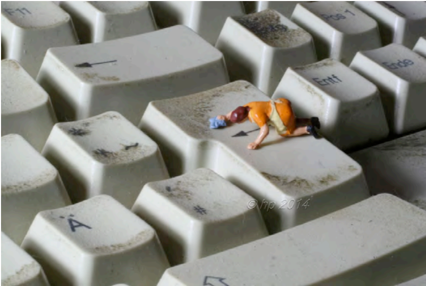
„Die Entdeckung der Winzigkeit“ inszenierte Fotografien von Henriette Putlitz (Teil der künstlerisch praktischen Prüfung LA Kunst an Grundschulen an der MLU Halle)